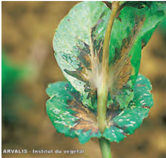
Symptômes de bactériose sur feuilles