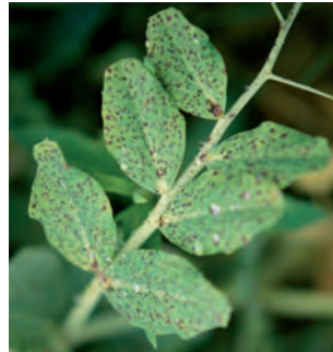
Symptômes d'anthraxose sur feuille

Les symptômes les plus caractéristiques de la bactériose sont les suivants :